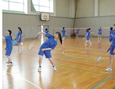
広いグラウンドと体育館